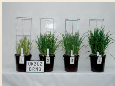
Nádobové pokusy, vegetační hala ÚKZÚZ Brno